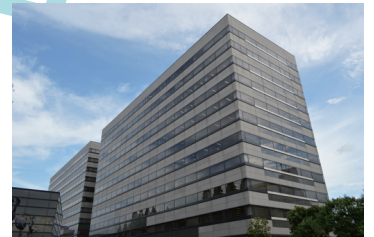
第一京浜から見たイメージ (手前: テクノポート大樹生命ビル)

〒144-0035 東京都大田区南蒲田 2-16-2 テクノポート大樹生命ビル 4F (受付)・1F